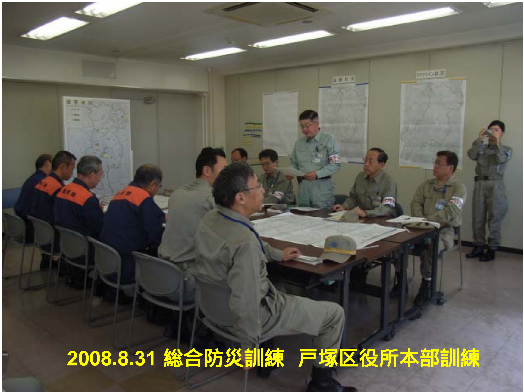
2008.8.31 総合防災訓練 戸塚区役所本部訓練